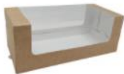
Коробка для кекса и рулета Крафт 20x10x10 см

На примере данной коробки рассмотрим схему сборки коробок.